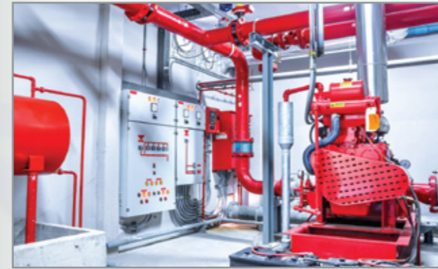
Tư vấn, thiết kế và cung cấp lắp đặt hệ thống Phòng cháy chữa cháy Consultation, design and supply and installation of fire protection systems