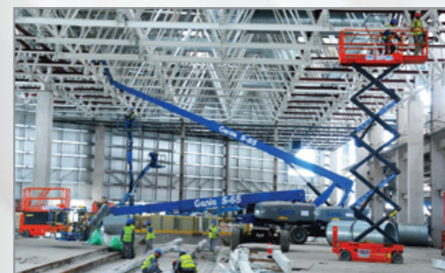
Lắp đặt hệ thống xây dựng khác Installation of other construction systems