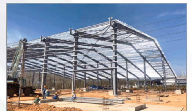
Hoàn thiện công trình xây dựng Completion of construction project