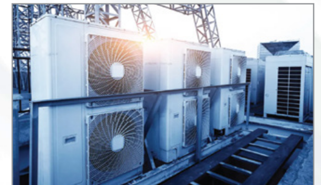
Tư vấn, thiết kế và lắp đặt hệ thống cấp, thoát nước, lò sưởi, điều hòa không khí và phòng sạch Consultation, design and installation of water supply and drainage systems, heating and air conditioning and clean rooms