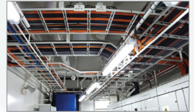
Tư vấn, thiết kế và lắp đặt hệ thống điện Consultation, design and installation of electrical systems