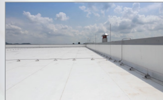
Tư vấn, thiết kế và lắp đặt hệ thống Chống sét Consultation, design and installation of lightning protection systems